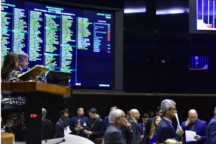
Sessão da Câmara dos Deputados.

Desde o enunciado, o substitutivo reorienta o projeto do novo arcabouço fiscal ( PLP 93/2023 ) para atender, além do previsto na PEC da Transição (Emenda Constitucional 126/2023, art. 6º), a chamada PEC da Emergência Fiscal (Emenda Constitucional 109/2021), em particular o inciso VIII e o parágrafo único do art. 163 da Constituição Federal, que estabelecem que “Lei Complementar disporá sobre sustentabilidade da dívida” e que autorizam a aplicação das vedações às despesas previstas no art. 167-A da CF.